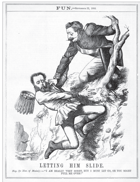
Figura 1. G. J. Pinwell y hermanos Dalziel, “Letting Him Slide”, The Fun, 22 de septiembre de 1866: 19.