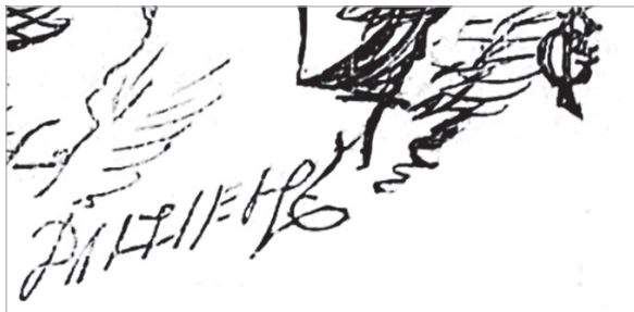
Figura 2. Detalle de la imagen donde se aprecia la firma "Dalziel" y el monograma "GP" de Pinwell. Pinwell y hermanos Dalziel, "Letting Him Slide", The Fun , 22 de septiembre de 1866: 19. "George A. Smathers Libraries", Universidad de Florida, https://original-ufdc.uflib.ufl.edu/UF00078627/00011/18x .

elaboró o coparticipó en el grabado de esta imagen, seguramente su trabajo fue supervisado y aprobado por Edward y George Dalziel.