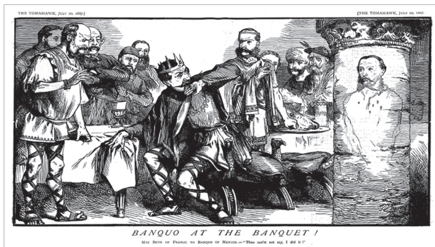
Figura 3. Matt Morgan, "Banquo at the Banquet", The Tomahawk , 20 de julio de 1867: 4-5, Nineteenth-Century Serials Edition, https://ncse.ac.uk/periodicals/t/issues/ttw_20071867/page/4/articles/pc00401/ .

la columna derecha del salón y con la camisa que lleva las balas recibidas en Querétaro el 19 de junio de ese año.