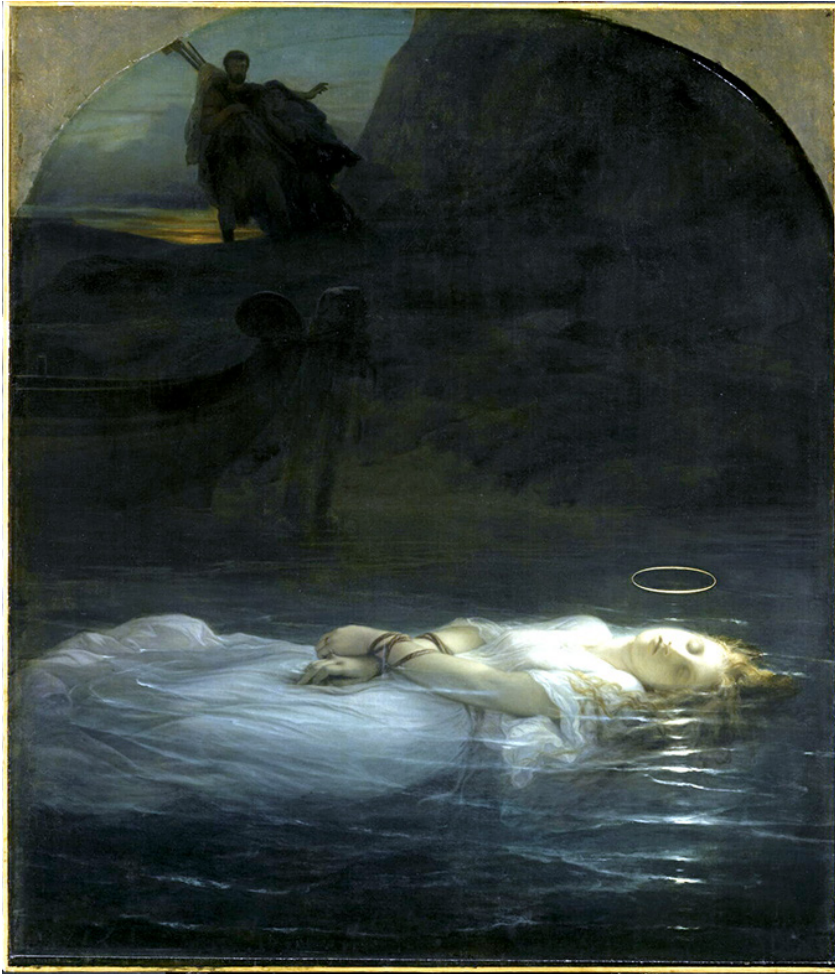
Figura 5. Paul Delaroche, "La jeune martyre". Museo de Louvre, https://collections.louvre.fr/en/ark:/53355/cl010066492 .